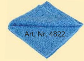
Art. Nr. 4822

MT blau gepresst - 70% Polyester, 30% Polyamid Ein sehr starkes dünnes Tuch in Sondergröße (40x45 cm) mit einer speziellen Webstruktur und gepresst! Das Tuch verursacht beim Reinigen eine leichte Schabewirkung ohne jedoch zu kratzen. Für hartnäckige Verschmutzungen oder bei schwer zugänglichen Stellen kann das Tuch in Fugen gedrückt werden um diese zu erreichen und reinigen! Randlos und ohne Etiketten, da sich dies bei manchen Einsätzen als hinderlich erweist!