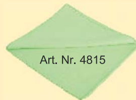
Art. Nr. 4815

MT blau randlos - 80% Polyester, 20% Polyamid Ein durch Ultraschall geläserter Rand verhindert beim Polieren und Reinigen auf heiklen Oberflächen ( schwarzer/frischer Autolack ), dass Schlieren oder Kratzer verursacht werden! Standardgröße (40x40 cm)