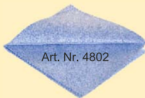
Art. Nr. 4802

MTW Waffelmuster - 30% Polyester, 70% Polyamid Ein durch eine spezielle Waffelstruktur ausgestattetes Tuch, mit dem besonders intensiv und viel Schmutz aufgenommen und gespeichert werden kann. Ideal zum Reinigen von Stoffen oder zum Abtragen bzw. Abpolieren von Oberflächen, ideal bei Autopolitur. Standardgröße (40x40 cm).