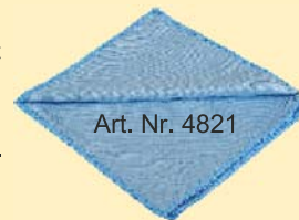
Art. Nr. 4821

MT rosa - 80% Polyester, 20% Polyamid (40x40 cm) Ein besonders saugfähiges mit zwei verschiedenen Oberflächen ausgestattetes Allzwecktuch. Eine Seite samtig weich, die andere Seite glatt. Das Tuch ist sehr anschmiegsam für schwer zugänglichen Kanten oder Oberflächen, diese können damit gut gereinigt und trocken gewischt werden. Anbringen und Auswischen von Flüssigpolitur od. Pflegemitteln!