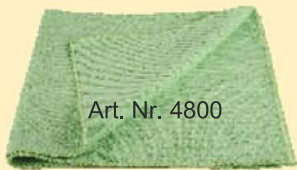
Art. Nr. 4800

PT 480 – Profituch grün 70% Polyester, 30% Polyamid Ein besonders großes (60x70 cm) und saugfähiges Tuch um viel Flüssigkeit über größere Flächen aufzunehmen. Ideal zum Nachrocknen nasser Flächen oder bei gereinigten Sitzflächen und Stoffen!