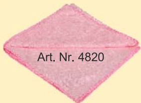
Art. Nr. 4820

MT grün - 70% Polyester, 30% Polyamid Ein saugfähiges samtig weiches Tuch in Standardgröße (40x40 cm) um gut Flächen möglichst ganz trocken zu wischen. Reinigen oder nachrocknen von Glas und Spiegelflächen. Verteilen und Auspolieren von Sprühpolitur. Als fusselfreies und wieder verwendbares Wischtuch vor Lackierarbeiten!